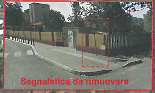
Segnaletica da rimuovere